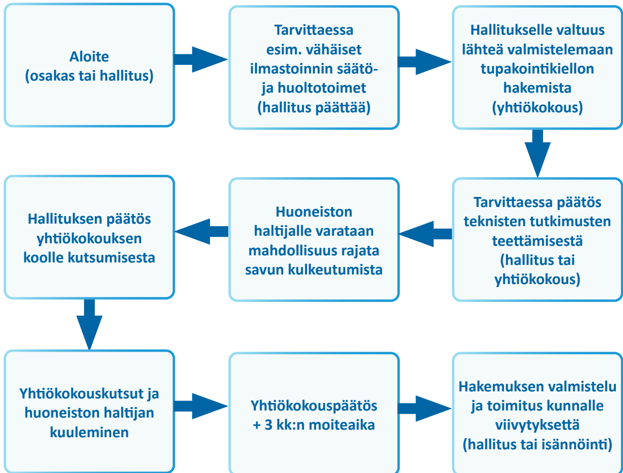
Kaavio 4: Prosessi taloyhtiössä – asuinhuoneiston asuintilan tupakointikielto

Kaaviossa 4 osa toimista on suositeltu saatettavaksi hallituksen tai yhtiökokouksen päätettäväksi. Se, kuuluuko toimenpide hallituksen vai yhtiökokouksen päätösvaltaan riippuu käytännössä esimerkiksi yhtiön koosta, toimenpiteen vaatimista kustannuksista sekä yhtiön korjausarviosta. Asunto-osakeyhtiölaki edellyttää, että olennaisesti asumiseen ja asumiskustannuksiin vaikuttavat asiat saatetaan yhtiökokouksen päätettäväksi. Vaikka toimi ei lain mukaan edellyttäisi yhtiökokouksen päätöstä, voi hallitus aina halutessaan saattaa asian yhtiökokouksen päätettäväksi. Asuinhuoneiston asuintilaan määrättävä tupakointikielto edellyttää lähtökohtaisesti teknistä näyttöä ja hallituksen kannattaakin hakea yhtiökokoukselta ylipäänsä valtuus lähteä valmistelemaan asuinhuoneiston asuintilaan määrättävän tupakointikiellon hakemista ja teettää tarvittavia teknisiä tutkimuksia. Näin riippumatta siitä, tuleeko asuintilan sisäosaan määrättävä tupakointikieltoasia vireille yhtiössä hallituksen tai osakkaan aloitteena.