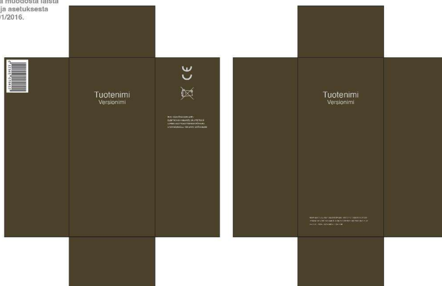
Illustration av detaljhandelsförpackning för elektroniska cigaretter fyllda med nikotinvätska.

Suuntaa-antava havainnekuva julkaistu 30.6.2022. Tarkat tiedot pakkauksen ulkoasusta ja muodosta laista 549/2016 ja asetuksesta 591/2016.