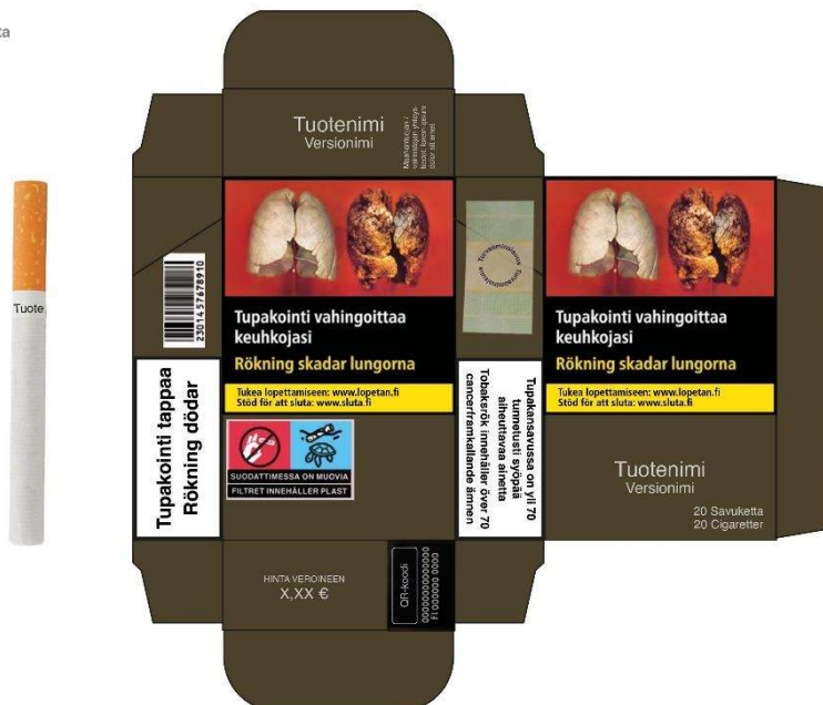
Illustration av detaljhandelsförpackning för rulltobak.

Suuntaa-antava havainnekuva julkaistu 30.6.2022. Tarkat tiedot pakkauksen ulkoasusta ja muodosta laista 549/2016 ja asetuksista 591/2016.